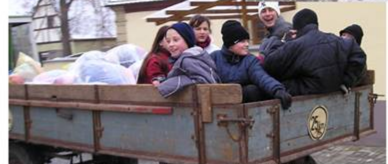
Die Präparanden sammeln Altkleider