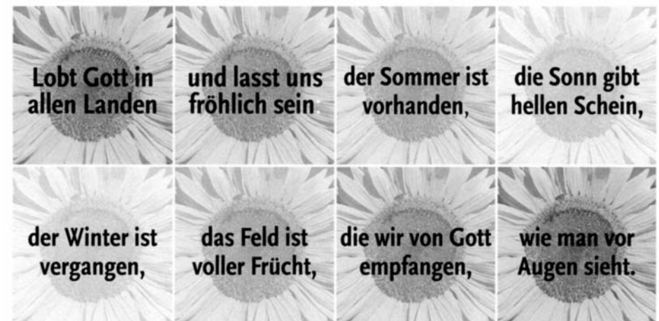
(Evangelisches Gesangbuch 500, Martin Behm)